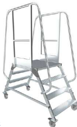
МПА - 2

Ограждение с одной стороны с возможностью перестановки на другую сторону