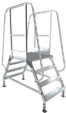
МПА - P