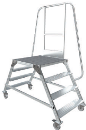
МПА - 1

Обеспечивает переход над конвейерными лентами и производственными линиями. Используется как в помещениях, так и на открытых площадках. Применяется для обслуживания различного оборудования на производстве, в магазинах, складах.