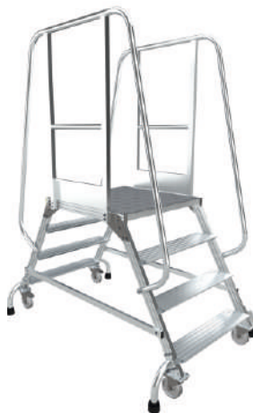
МПА - T