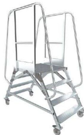
МПА - Y